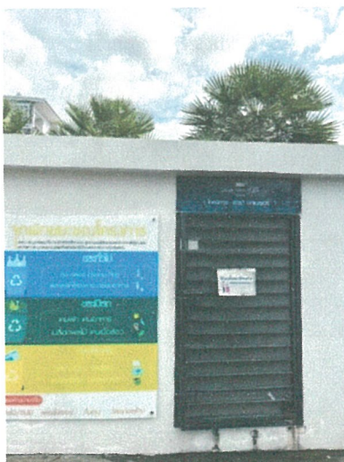
รูปภาพที่ 2.11 ห้องพัสดุฝอยรวม