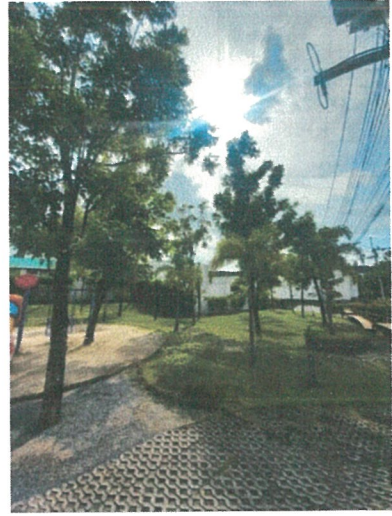
รูปภาพที่ 2.1 พื้นที่สีเขียว