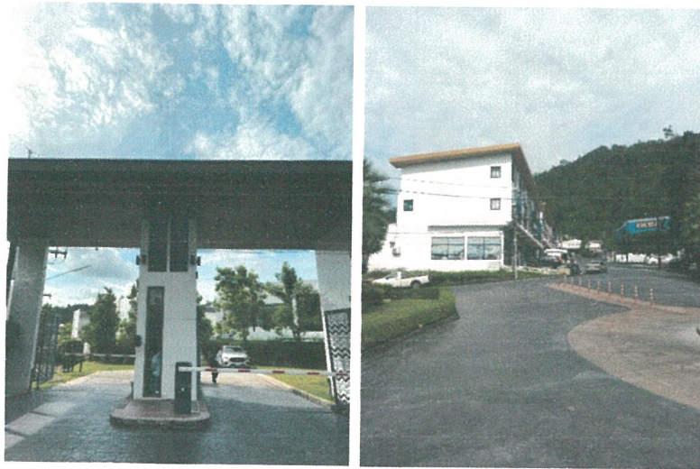
รูปภาพที่ 2.5 ทางเข้า-ออกโครงการ