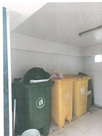
รูปภาพที่ 2.1 ถังขยะแยกประเภท