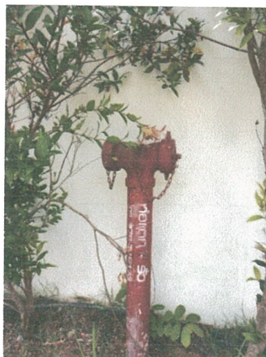
รูปภาพที่ 2.7 หัวรับน้ำดับเพลิง