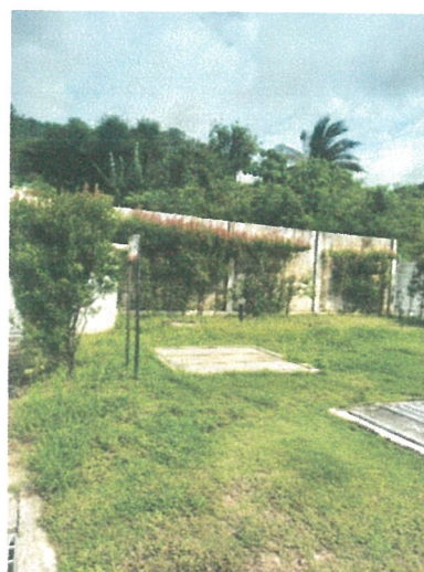
รูปภาพที่ 2.8 ระบบบำบัดน้ำเสีย