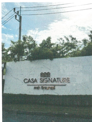
รูปภาพที่ 2.3 ป้ายชื่อโครงการ