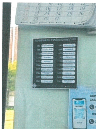
รูปภาพที่ 2.16 เบอร์โทรคัพท์ฉุกเฉิน