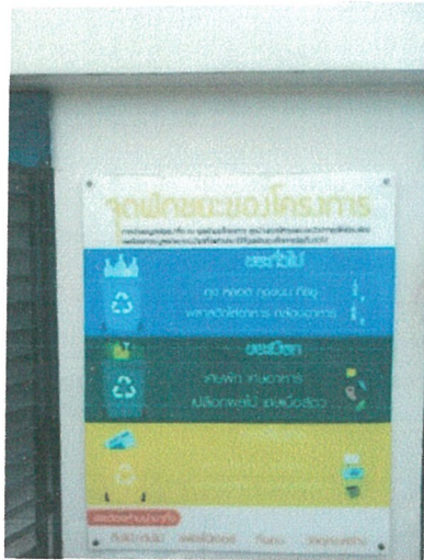
รูปภาพที่ 2.13 ป้ายรณรงค์คัดแยกมูลฝอย