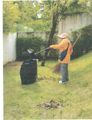
รูปภาพที่ 2.2 งานดูแลสวน