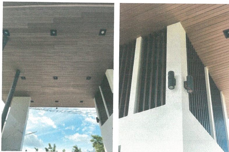
รูปภาพที่ 2.6 ไฟฟ้าส่องสว่างบริเวณทางเข้า-ออก