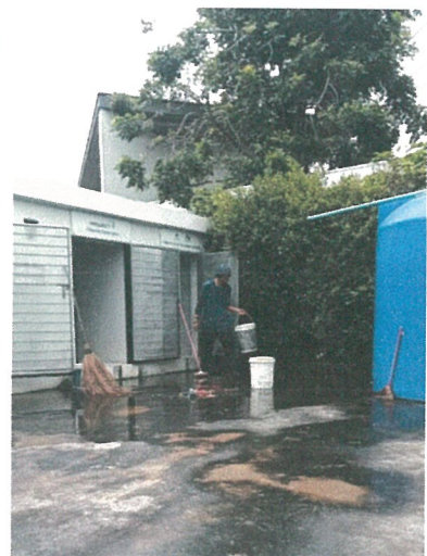
รูปภาพที่ 2.15 การล้างทำความสะอาดห้องพักขยะมูลฝอยรวม