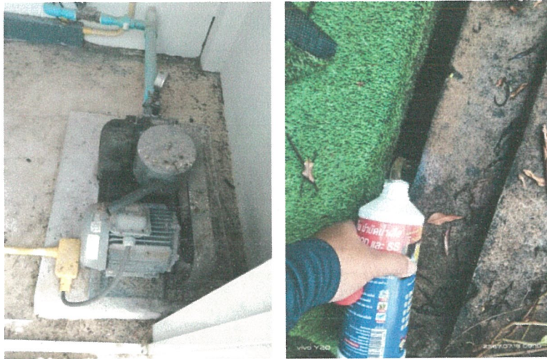
รูปภาพที่ 2.9 การตรวจสอบการทำงานของระบบบำบัดน้ำเสีย