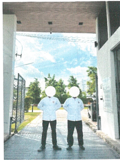
รูปภาพที่ 2.4 เจ้าหน้าที่รักษาความปลอดภัย