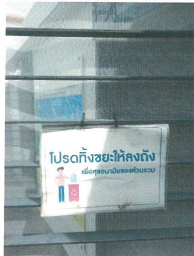
รูปภาพที่ 2.14 ป้ายกรุณาทิ้งขยะลงถัง